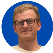
AUGUSTIN DE FAUCONVAL