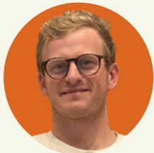
AUGUSTIN DE FAUCONVAL